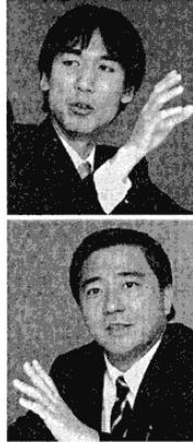
自民党衆議院議員 城内 実氏(38) 民主党衆議院議員 長島 昭久氏(41)